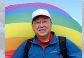
先日、北九州営業所のみなさんと北九州市にある「血倉山」へ登山に行ったときのお写真。